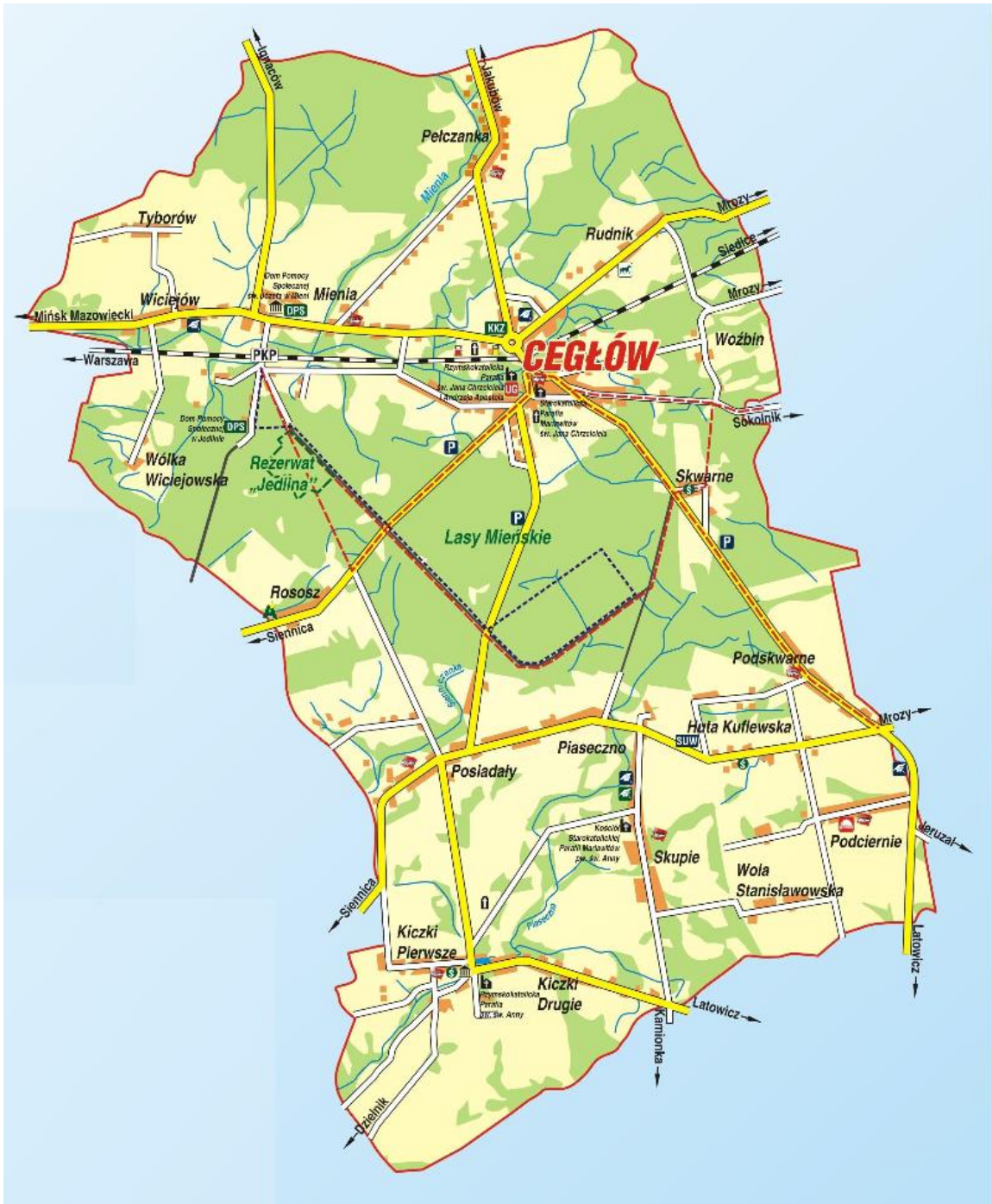
Mapa gminy Cegłów

Przez Gminę przepływają dwa prawostronne dopływy Świdra, czyli rzeka Mienia i rzeka Piaseczna.